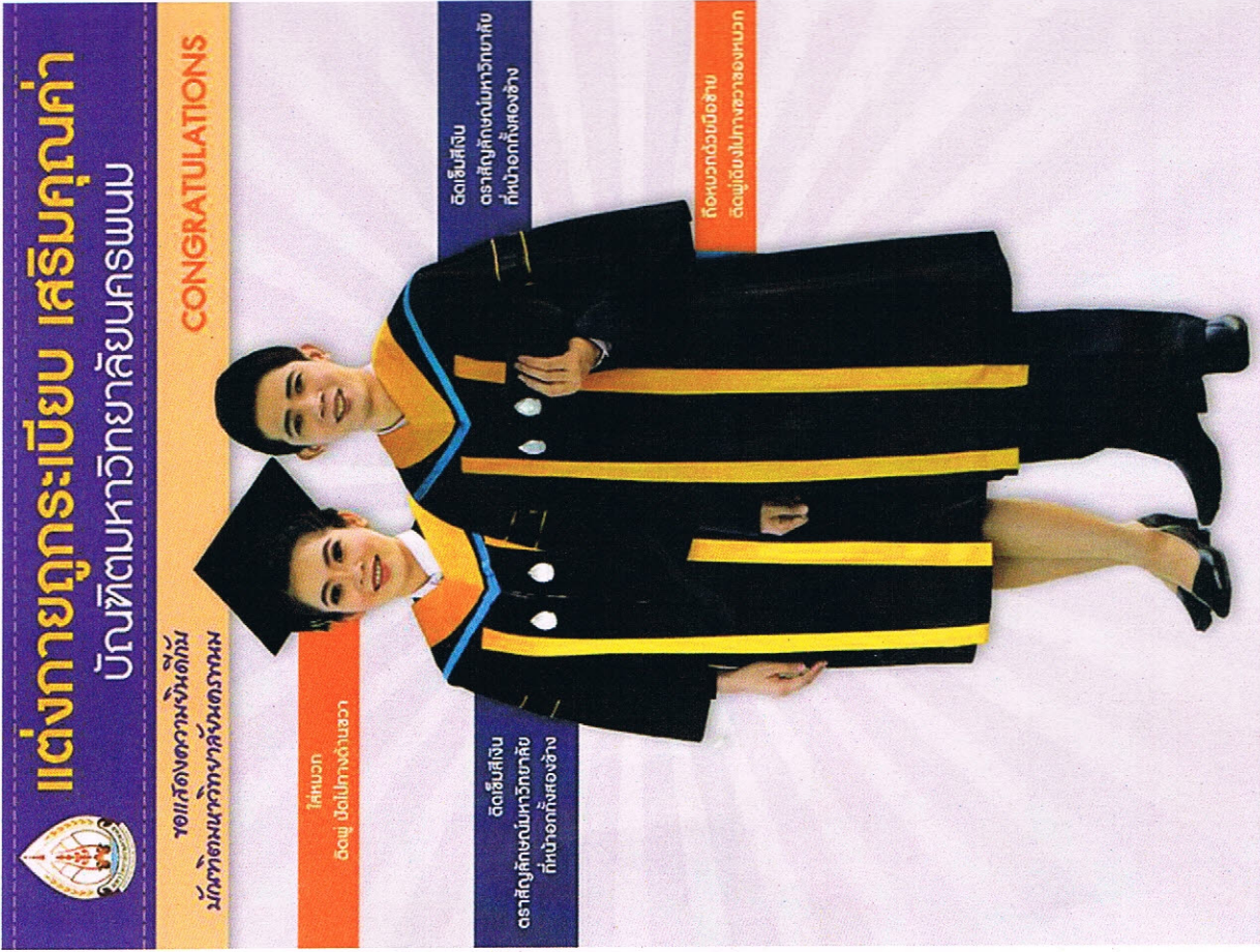
ภาพที่ ๓ การแต่งกายบัณฑิตสวมชุดครุยวิทยฐานะมหาวิทยาลัยนครพนม