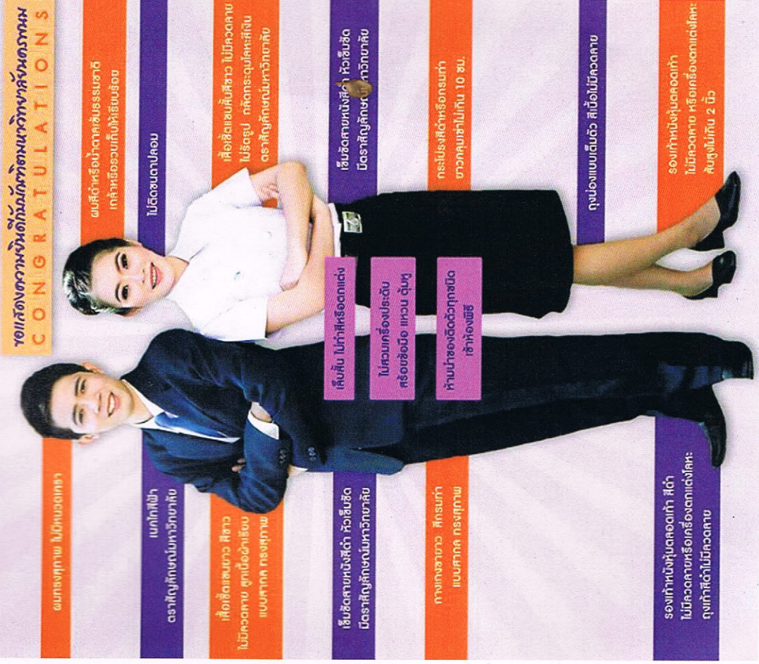
ภาพที่ ๒ การแต่งกายของบัณฑิตชายและบัณฑิตหญิง